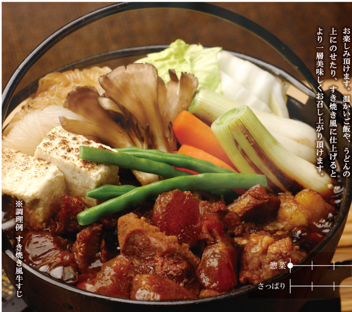
※調理例 すき焼き風牛すじ

国産牛すじ肉をじっくりと柔らかく煮込みました。濃厚な味わいをご家庭でも簡単にお楽しみ頂けます。温かいご飯や、うどんの上にのせたり、すき焼き風に仕上げるとより一層美味しくお召し上がり頂けます。