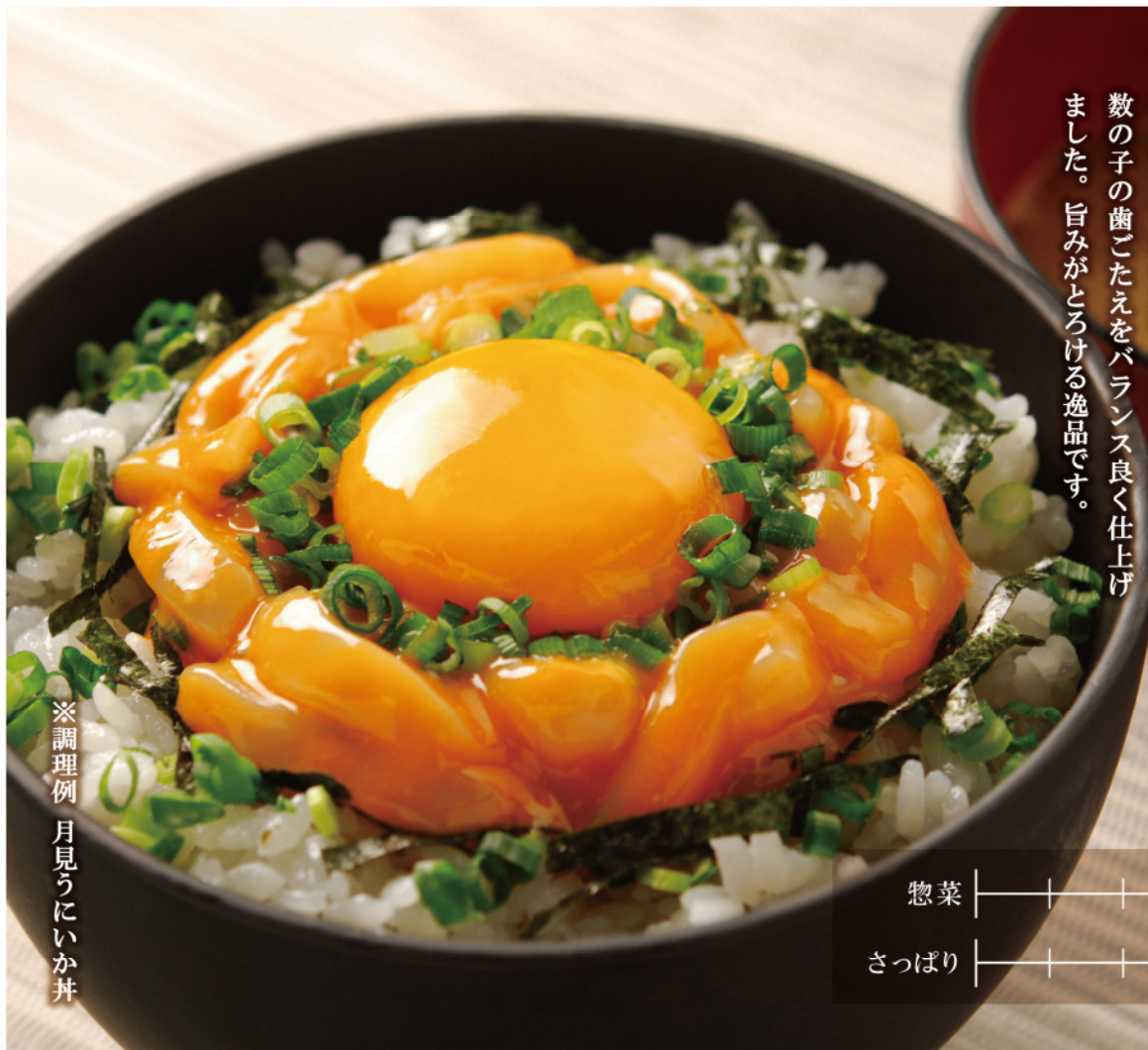
※調理例 月見うにいか丼

いかの身の部分を使用し、新鮮な「うに」・熟成された「酒粕」・「数の子」を合わせました。いかの風味・うにと酒粕の甘味、数の子の歯ごたえをバランス良く仕上げました。旨みがとろける逸品です。