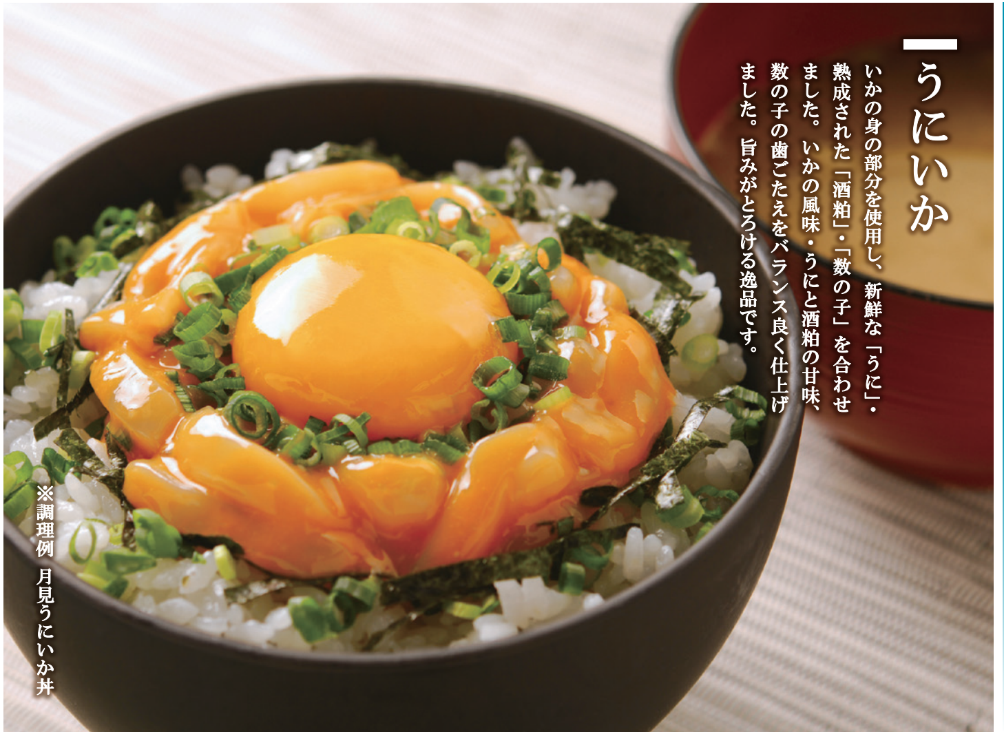
※調理例 月見うにいか丼

いかの身の部分を使用し、新鮮な「うに」・熟成された「酒粕」・「数の子」を合わせました。いかの風味・うにと酒粕の甘味、数の子の歯ごたえをバランス良く仕上げました。旨みがとろける逸品です。