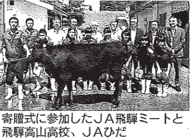
寄贈式に参加したJA飛騨ミートと飛騨高山高校、JAひだ

【岐阜・飛騨】JA飛騨ミートは7月中旬、高山市山田町の県立飛騨高山高校山田校舎で「雌肥育素(もと)牛寄贈式」を行い、同校の生物生産科へ肥育用の雌子牛を寄贈した。 2015年から毎年、子牛の寄贈をしている。今回で4頭目となる。寄贈式には、飛騨ミートや同校生徒、JAひだ