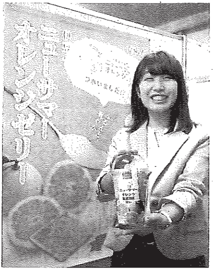
ニューサマーオレンジゼリーを紹介

【静岡・伊豆太陽】神奈川県小田原市にある加工品メーカー・しいの食品は、夏の行楽シーズンに合わせ1日、JA伊豆太陽の特産ニューサマーオレンジを使ったゼリーの販売を始めた。