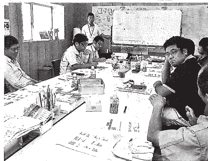
グループ討論で各団体の問題を話し合う参加者

JAあいち豊田管内の「よさみ」の計12人が参加した。若手社員育成も視野に入れている。JAあいち中央管内の「よさみ」の計12人が参加した。若手社員育成も視野に入れている。JAあいち中央管内の「よさみ」の計12人が参加した。若手社員育成も視野に入れている。